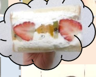
きくかわの「フルーツサンドを食す会」