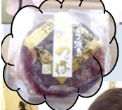
フレッシュ栄月の「きんつばを食す会」