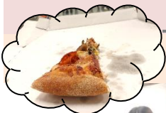
ドミノピザの「ピザを食す会」