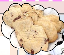
わかばの「たい焼きを食す会」