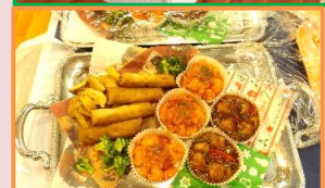
初の中華オードブル