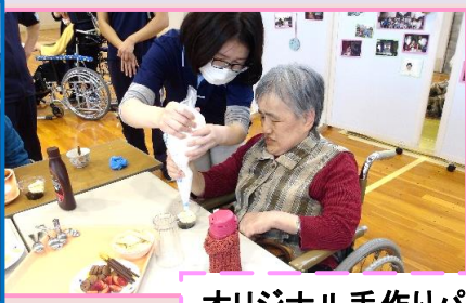
オリジナル手作りパフェ！