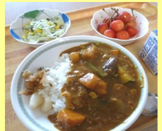
障害者支援施設、ケアハウス