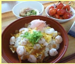
特別養護老人ホーム