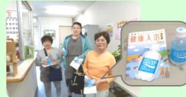
6/27 ポカリスエットプレゼント

平成27年5月 G o プール! G o 温泉! 5・26まつり開催 5月26日(火)に無料開放を行いました。 平成27年6月 YBCラジオに出演 ポカリスエットプレゼントイベント実施 6月25日(木)「ゲツキンラジオばんぱかばーん」の 「ポカリスエット日帰り温泉ツアーズ」に生放送で電話出演いたしました。 6月27日(土)先着240名にポカリスエットプレゼントイベントを行いました。 平成27年7月 第13回水上安全法講習会 実施予定 大郷小学校3年生児童・明治小学校6年生児童が参加予定です。