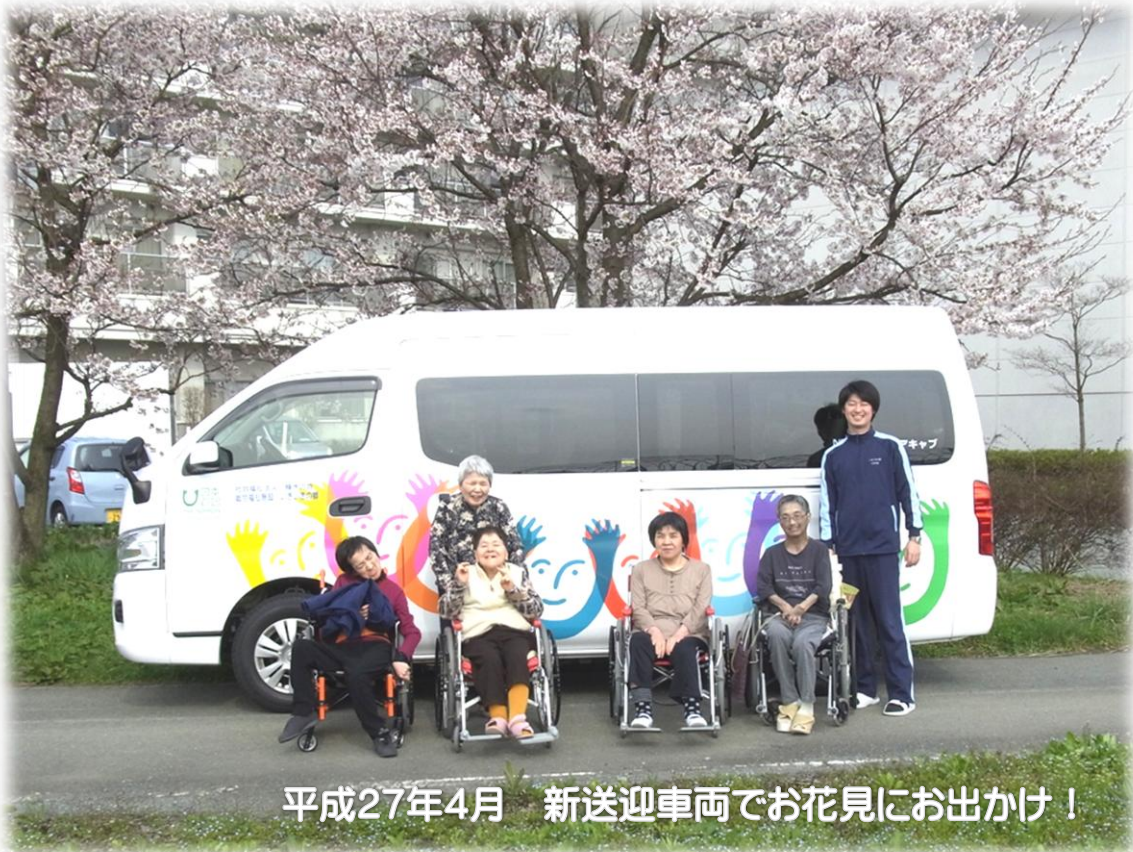
平成27年4月 新送迎車両でお花見にお出かけ！