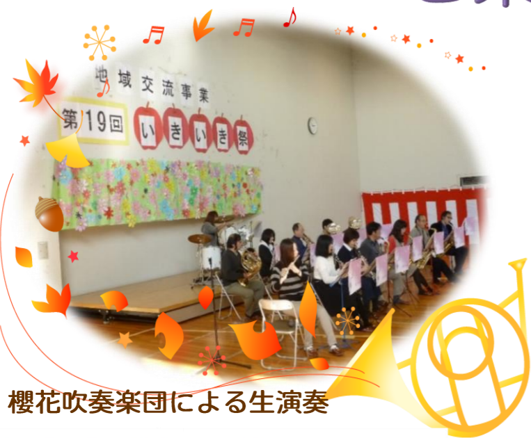
桜花吹奏楽団による生演奏