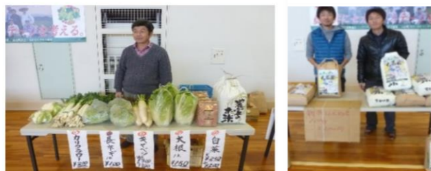
今年も人気！成安地区特産物販売