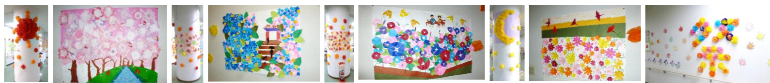
利用者・入居者による壁面装飾・作品展示