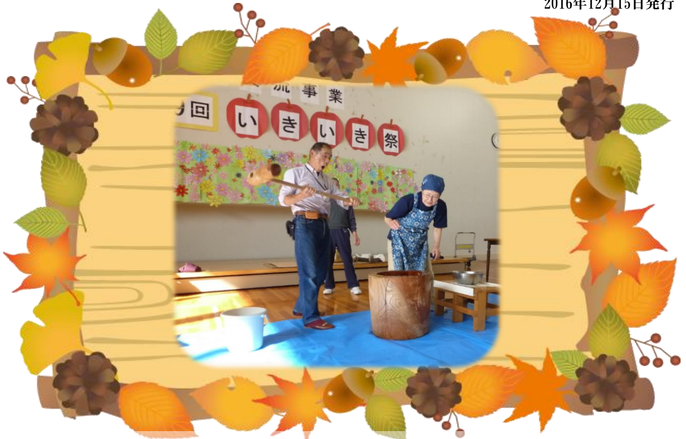
ケアハウス入居者と地域の皆様で育てたもち米で餅つき・振る舞い